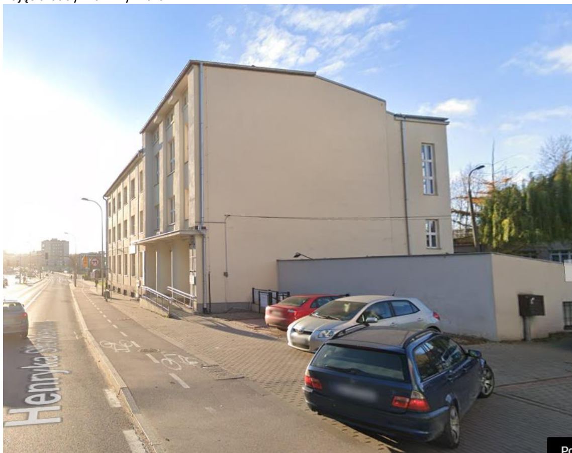
Zdjęcia budynku z wymiarami